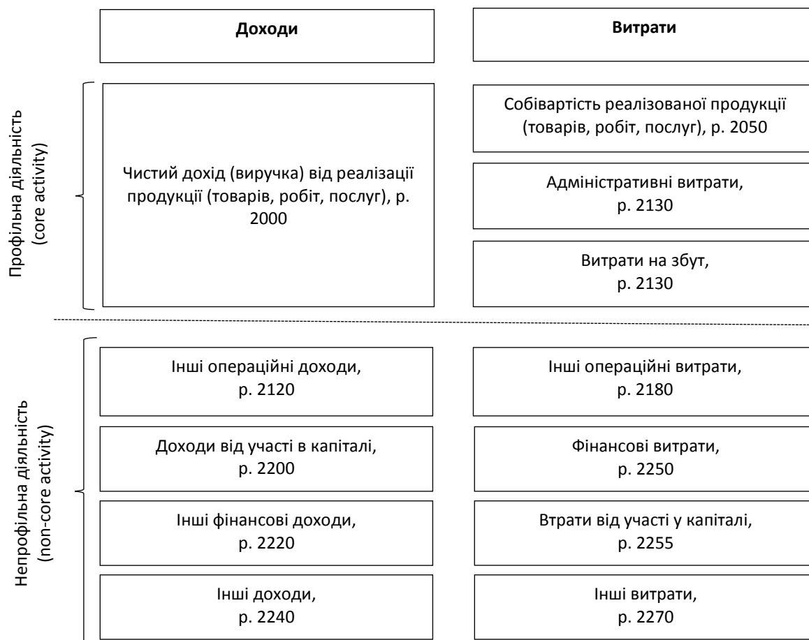
Рис. 2. Фінансові ефекти діяльності виробничо-комерційного підприємства 1